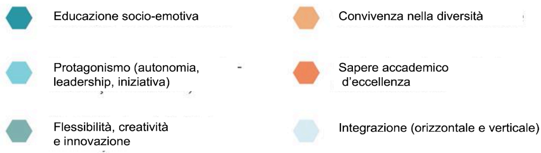
Figura 1 ASSI DELLA PROPOSTA PEDAGOGICA

Basandosi su una storia di tradizione consolidata e innovazione costante, il liceo si impegna a fornire un'offerta formativa seguendo precise direzioni pedagogiche: