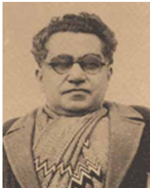
Já no fim da vida, em 1935, Gramsci tinha a saúde debilitada. Morreu em 1937, cerca de três anos após ter conseguido liberdade condicional da prisão

foram posteriormente chamados de Cadernos do Cárcere e Cartas do Cárcere . A primeira edição das Cartas foi publicada em 1947, seguida pelos volumes dos Cadernos , divididos, inicialmente, nos temas: O materialismo histórico e a filosofia de Benedetto Croce (1948), Os intelectuais e a organização da cultura (1949), O Risorgimento (1949), Notas sobre Maquiavel, a política e o Estado moderno (1949), Literatura e vida nacional (1950), Passado e presente (1951). A maior parte desse seu legado, publicado postumamente após a Segunda Guerra, foi redigida com uma linguagem cifrada para driblar a censura fascista, modo pelo qual se valia de conceitos como “bloco histórico”, “intelectual orgânico”, “hegemonia” e, quando se referia ao marxismo, “filosofia da práxis”.