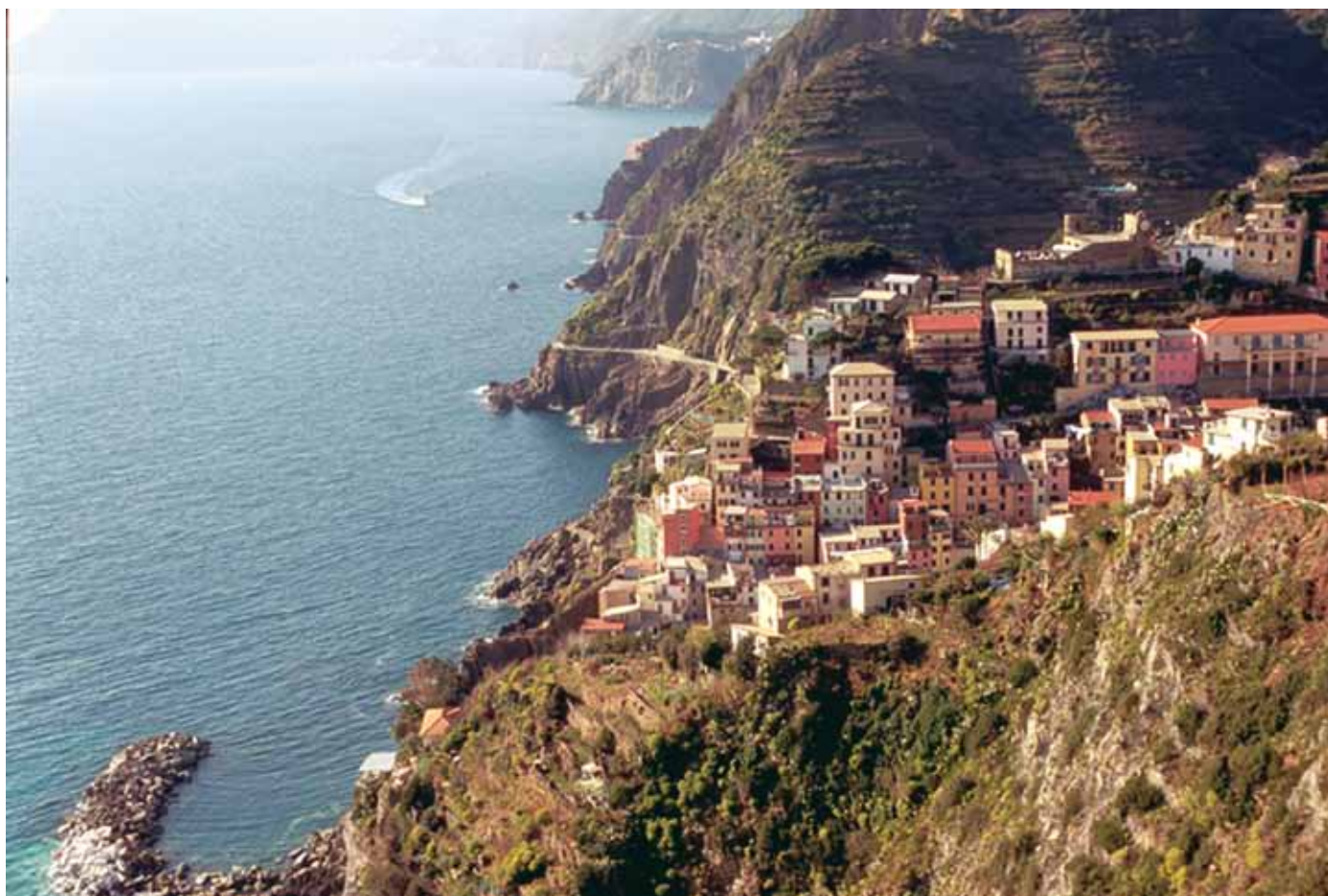
As moradias em Riomaggiore são exemplo da obstinação humana: foram construídas em uma região extremamente acidentada

Deixemos, porém, por enquanto, a ideia do mar, considerando-se que a nossa rota de penetração na Ligúria será por terra, a começar pelo lado sul do arco. Aqui se apresenta, de saída, um dilema, o da escolha da estrada: temos a estupenda Autostrada Azzurra , pista construída na segunda metade do século passado; e a Via Aurelia , um traçado romano do terceiro século a.C. que servia de ligação com os portos do mar Tirreno superior. Nossa escolha será a Via Aurelia , já que os antigos caminhos representam rios de história, onde os fatos memoráveis permanecem presentes, petrificados nos restos do passado, nos monumentos que acompanham o seu percurso.