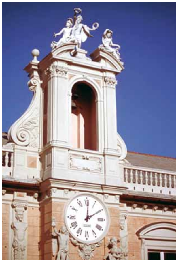
A praça municipal de Gênova, a Grandiosa, cidade reconhecida pela riqueza arquitetônica

Entre as igrejas que merecem uma visita obrigatória, temos a catedral de San Lorenzo , em estilo românico, embora sua fachada seja gótica –