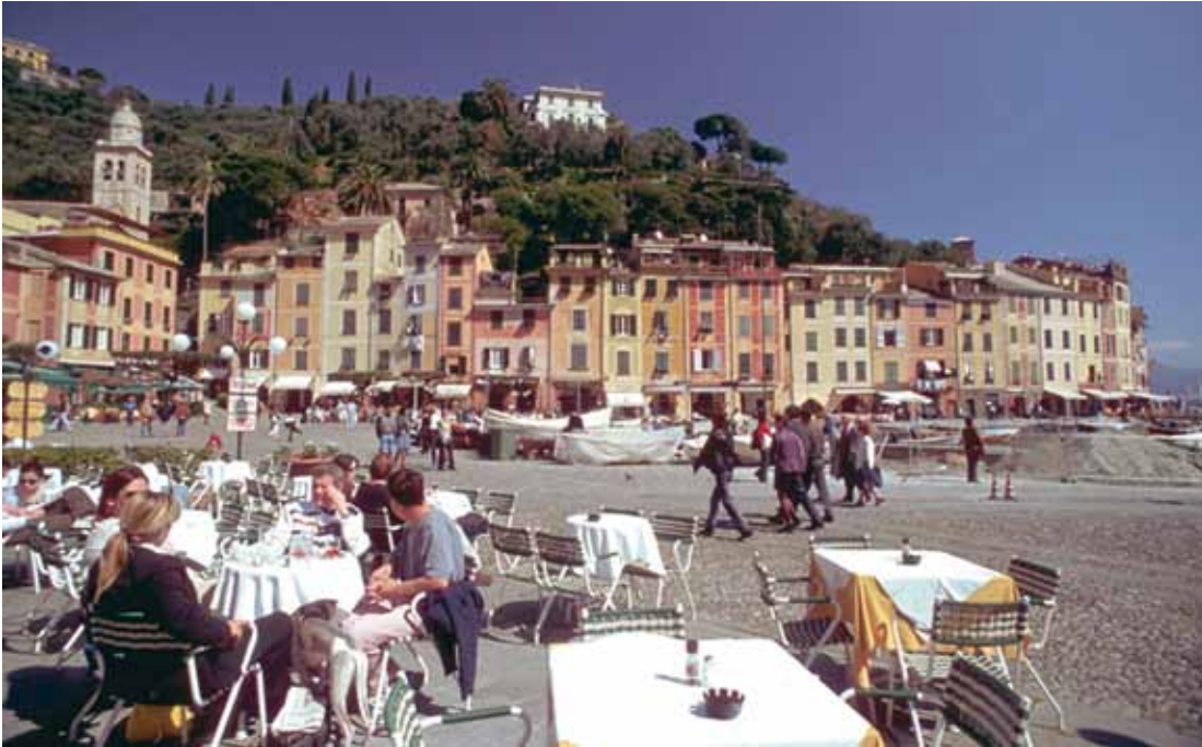
Portofino e Camogli são duas cidades marítimas praticamente habitadas por turistas: a “temporada” dura o ano todo

Conhecer, de forma completa, todos os burgos e locais interessantes que a Ligúria oferece, representa um trabalho que extrapola os limites da nossa disposição, já que cada ângulo dessa terra reserva surpresas realmente inacreditáveis. Assim, o que se procurou foi oferecer ao nosso leitor um leque dos lugares mais interessantes.