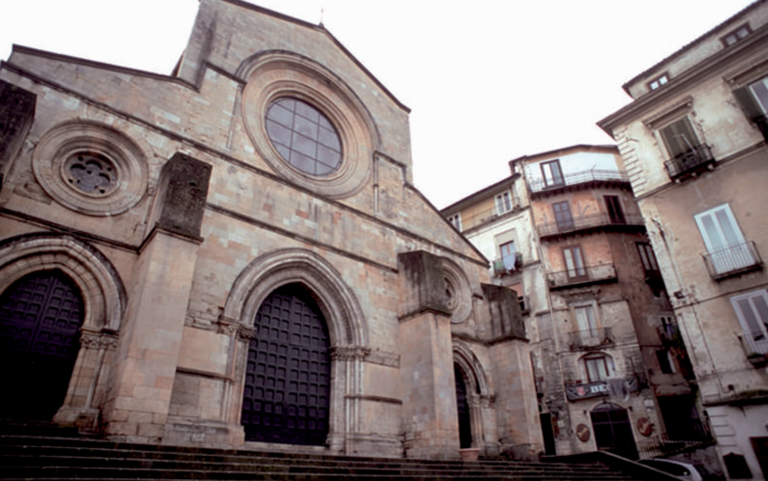
O Duomo de Cosenza, restaurado em 1184, mantém o estilo românico original