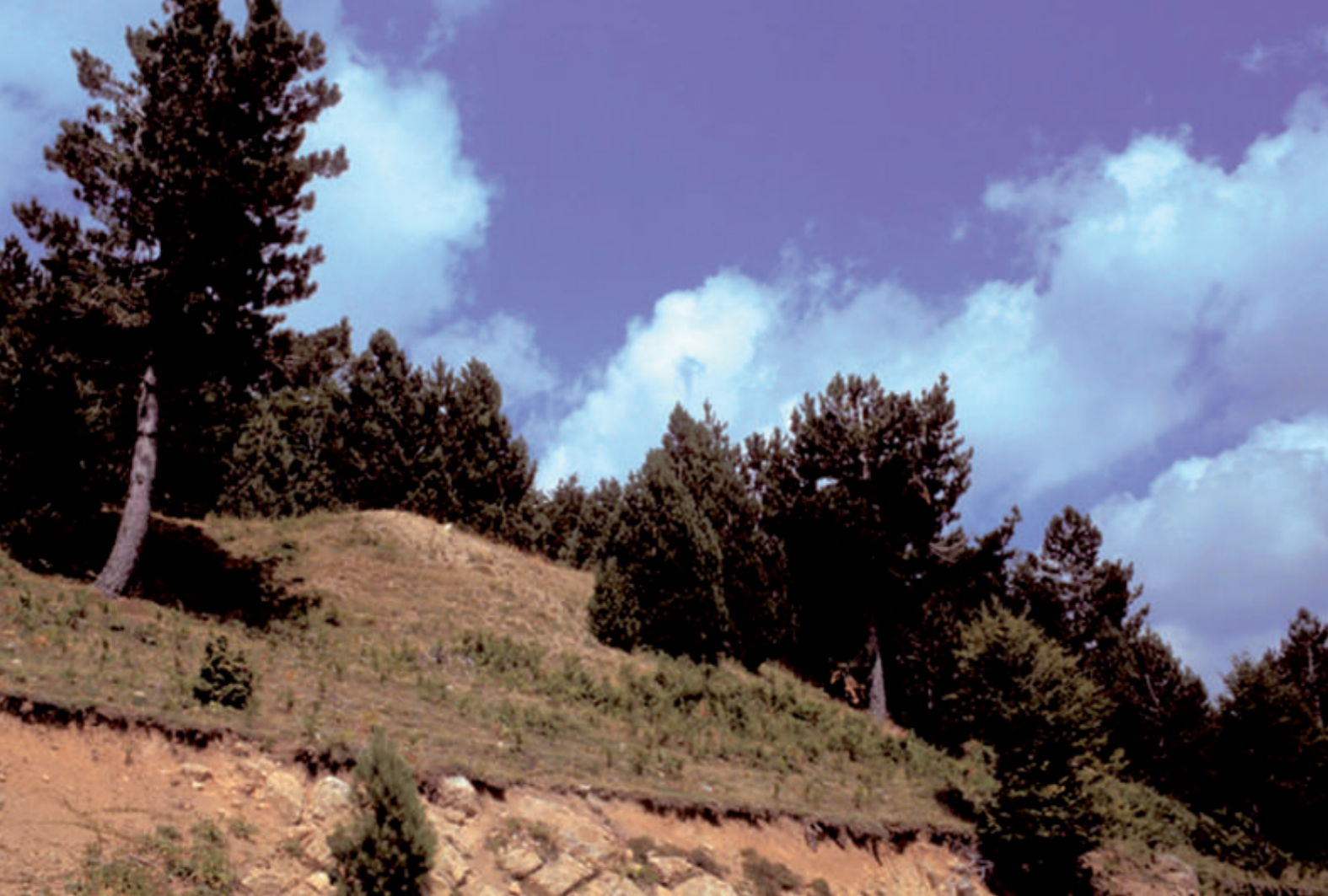
A terra áspera da Calabria, no Altopiano della Sila

deixaram testemunhas notáveis, principalmente a Fortaleza e a Catedral, autênticas jóias arquitetônicas e artísticas. A Catedral, de origem bizantino-normanda e consagrada em 1045, foi restaurada várias vezes e possui três naves divididas por vinte colunas.