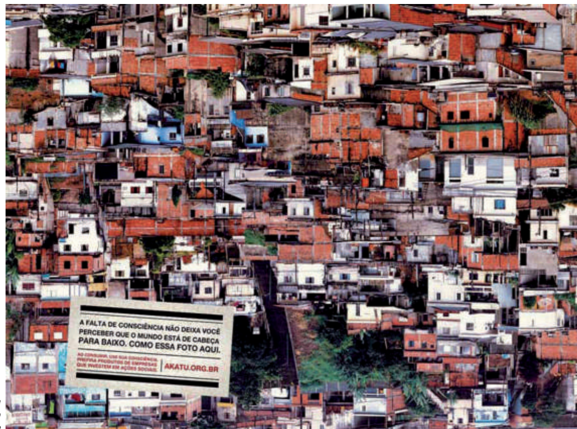
A peça publicitária "Favela", do Movimento Cuide

nosso site o teste do consumo consciente, baseado em estatísticas que fizemos: de acordo com ele, existem 13 comportamentos que definem quem é um consumidor consciente. Fizemos uma classificação no Akatu: dos 13 comportamentos, para ser engajado você tem que cumprir entre oito e dez. E para ser consciente, entre 11 e 13. Até pouco tempo atrás, eu era apenas engajado. Entre as atitudes que pratico, estão fechar a água quando tomo banho, quando escovo os dentes, quando, no fim de semana, lavo a louça. Desligar a lâmpada quando saio dos ambientes, desligar aparelhos eletrônicos quando não estou usando (desligo inclusive o controle remoto, que consome 25% da energia do aparelho quando ele está ligado). Eu uso o outro lado da folha de papel, compro produtos orgânicos, planejo compra de alimentos, peço nota fiscal, leio rótulos antes de comprar. Segundo a pesquisa mais recente, de 2006, no Brasil não existe nenhum consumidor que cumpra os 13 comportamentos. Apenas recentemente eu introduzi mais um comportamento: o da reciclagem do lixo. Cuido muito da água e da energia, eles são emblemáticos, porque são elementos extremamente importantes para o aquecimento global. Energia, porque não existe geração de energia sem emissão de carbono. Mesmo no Brasil, em que temos quase 80% de geração de